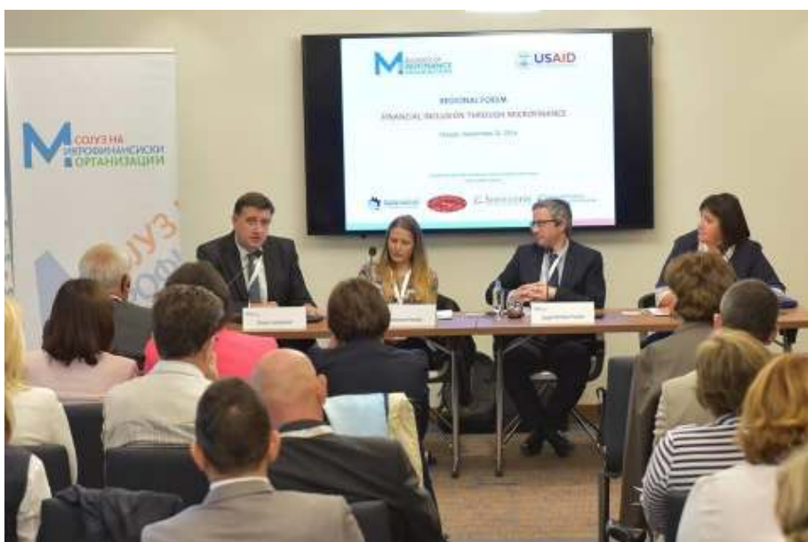
Со претставниците на Европската микрофинансиска мрежа и Центарот за микрофинансирање од Полска

Форумот отворен од страна на Гувернерот на НБРМ, Министерот за финансии и директорот на мисијата на УСАИД во Македонија, со над 90 учесници од јавниот, деловниот и граѓанскиот сектор но и Европската мрежа за микрофинансирање-Брисел и центарот за микрофинансирање-Варшава,