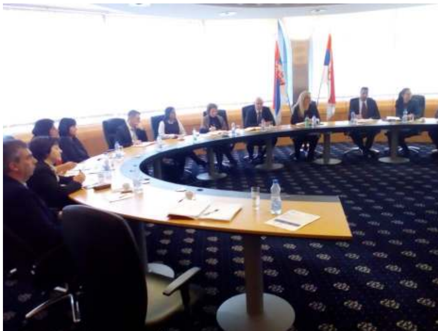
Од средбата со Народна банка на Србија

Во текот на посетата беше воспоставена соработка со релевантните институции и беа обезбедени мошне значајни информации за регулаторните предизвици и имплементациските искуства во оваа сфера, како силен придонес за успешна асистенција на домашните регулатори во процесот, во насока на вклучување на микрофинансиските институции како платни оператори.