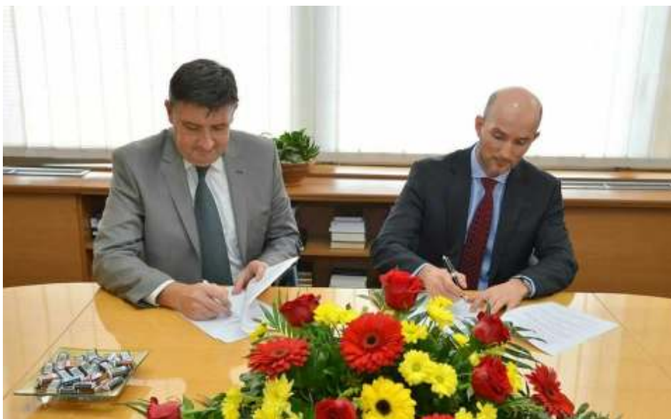
Од потпишувањето на меморандумот за соработка со НБРМ

За таа цел, партнерски односи беа воспоставени меѓу Сојузот и клучните институции од јавниот и приватниот сектор, организации, како и со групи на граѓанските организации активни во доменот на интерес на микрофинансирање.