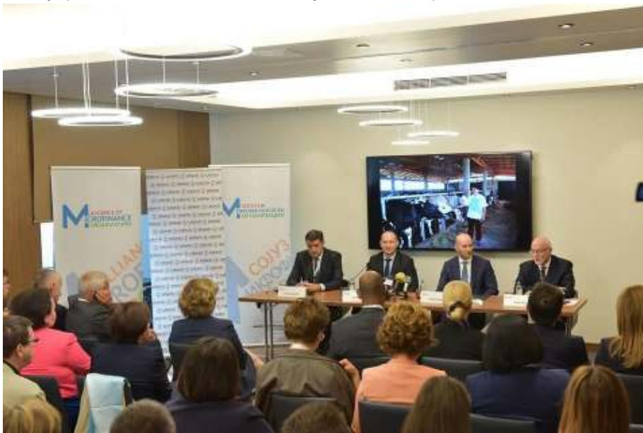
Отворање на регионалниот форум

влијание во работата на Сојузот со регулаторите, со нивно значително присуство и учество во процесот. Беа презентирани регулаторни предизвици и практики од поширокиот регион и беше договорена континуирана дебата со колегите од јавниот сектор.