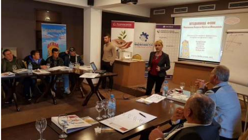
Обука за финансиски знаења во Велес

Во периодот јули-август, во консултации со партнерите на проектот а врз основа на искуствата со целната група, беа идентификувани индикативните теми за обука во областа на финансиите а