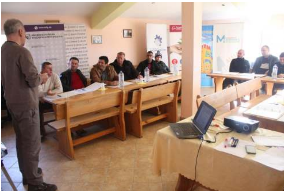
Обука за финансиски знаења во с. Мустафино

Во периодот јули-август, во консултации со партнерите на проектот а врз основа на искуствата со целната група, беа идентификувани индикативните теми за обука во областа на финансиите а