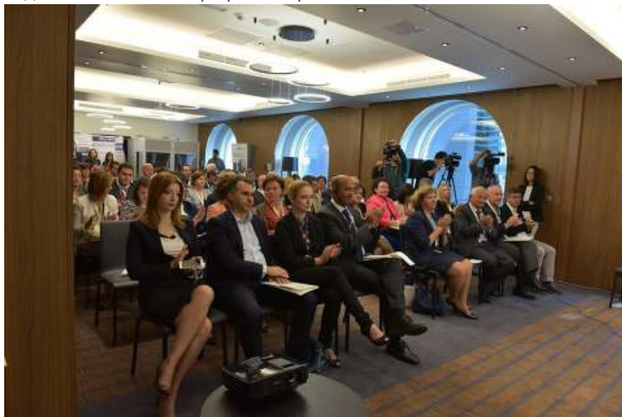
Учесници од јавниот, приватниот и граѓанскиот сектор на форумот