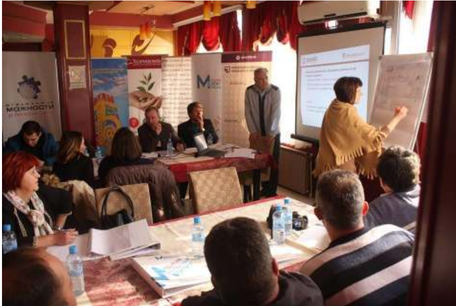
Обука за финансиски знаења во Кавадарци