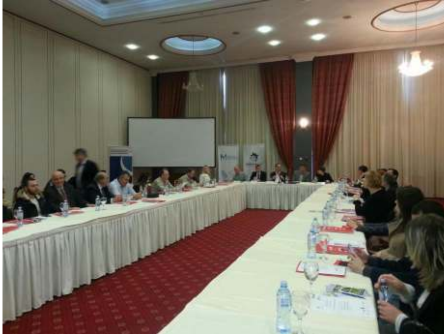
Учество на конференцијата на АППРМ

Со овие партнери беше инициран процес за идентификување на приоритетите и полињата од заеднички интерес како и можни заеднички напори, за реализирање на активности во иднина.