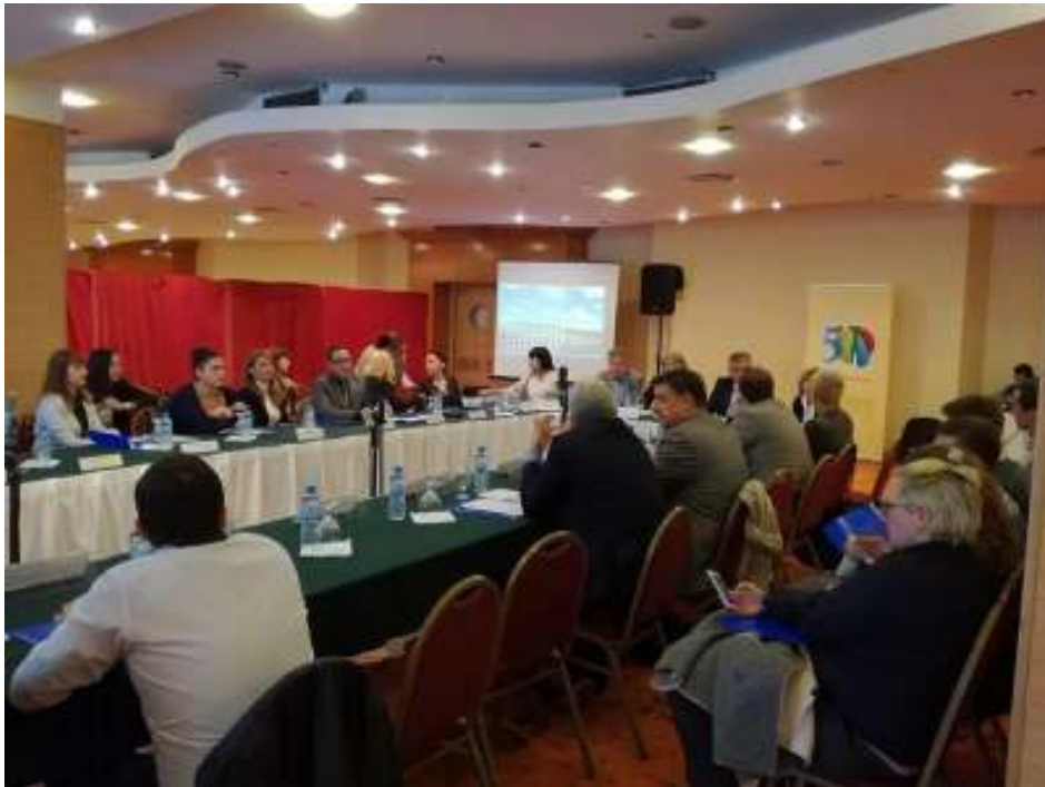
Обраќање на симпозиумот на ИСППИ за практиканство

Сојузот оствари активно учество во серија настани на организациите од јавниот сектор со кои воспостави соработка во насока на јакнење на релевантноста на Сојузот како партнер во јавно-приватниот дијалог.